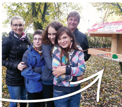
Děti se do výroby krmítka pustily s chutí a celý den je to bavilo.