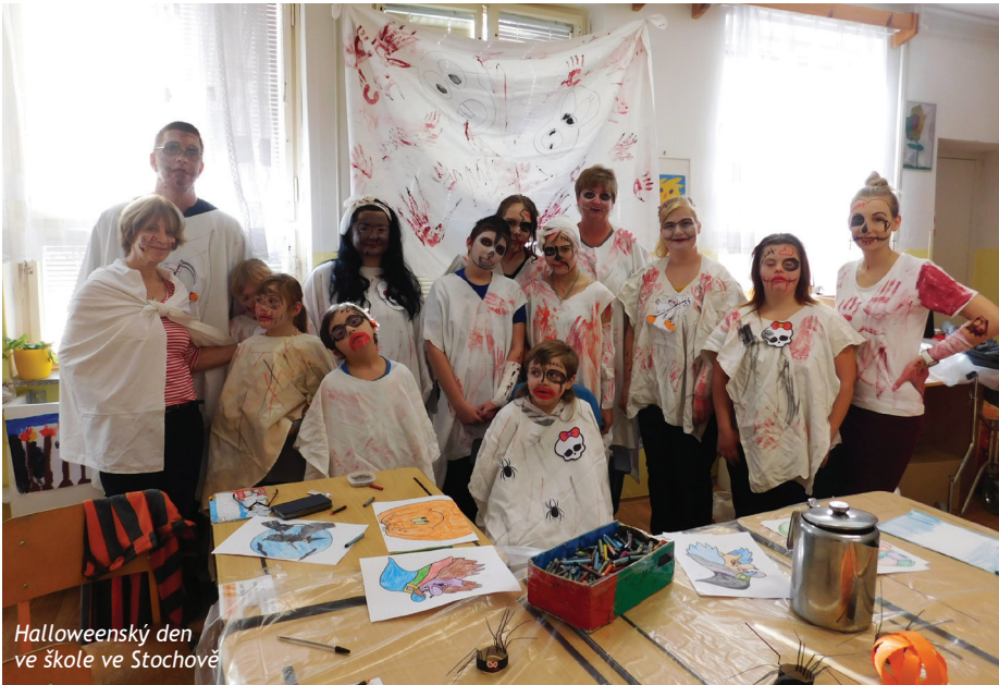
Halloweenský den ve škole ve Stochově