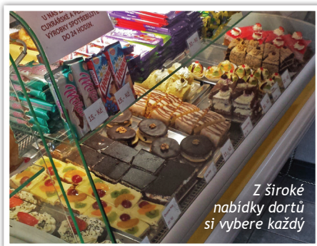
Z široké nabídky dortů si vybere každý

Do provozu kavárny a pekárny se zapojily posily. S novými tvářemi se budete potkávat především v kavárně, kde se už všichni těší na Vaši návštěvu. ■