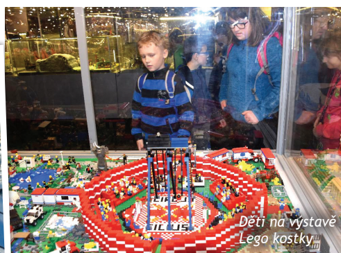
Děti na výstavě Lego kostky

ledna vypravily do Prahy na vzdělávací výstavu modelů z Lego kostek, která se konala v areálu Výstaviště v Holešovicích. Žáci zhlédli například model Titanicu složený z půl milionu kostek, železniční modely s jezdícími vlaky, lunapark, hudební nástroje a spoustu dalších staveb. Menším dětem se velmi líbilo v zábavné zóně s kostkami oblíbené stavebnice. Zpět do školy se všichni vraceli spokojeni a se spoustou zážitků.