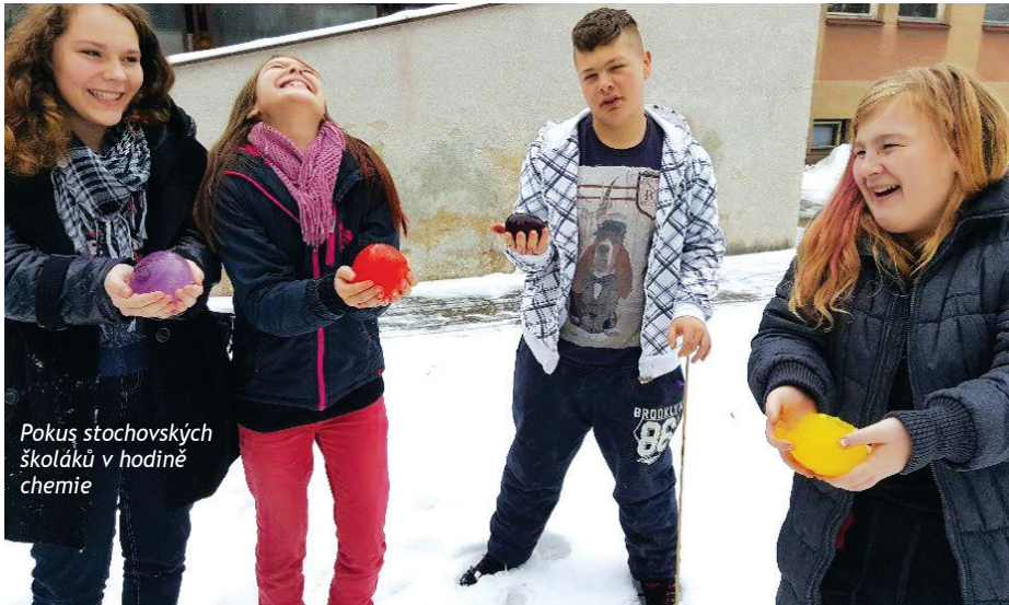
Pokus stochovských školáků v hodině chemie