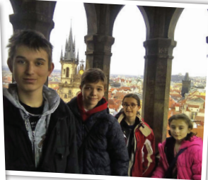
Po focení se šly děti s doprovodem podívat na Staroměstskou věž