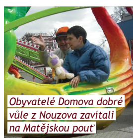
Obyvatelé Domova dobré vůle z Nouzova zavítali na Matějskou pouť