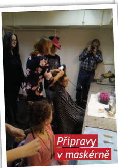
Přípravy v maskárně

Tip: Pokud jste si ještě nestačili do Divadla Bez zábradlí v pražské Jungmanově ulici zajít, určitě doporučujeme. A třeba právě na hru Blbec k večeři nebo oblíbenou komedii Art. ■