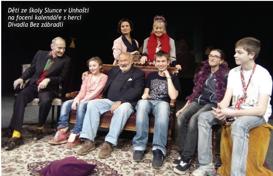
Děti ze školy Slunce v Unhošti na focení kalendáře s herci Divadla Bez zábradlí