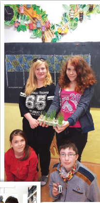
▲ Děti měly radost z vyrostlého osení

Ve druhé polovině dubna se pak konaly zápisy do 1. tříd našich škol. ■