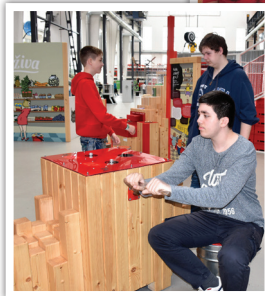
◀ Učíme se hrou v plzeňské Techmanii