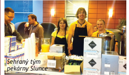
Sehraný tým pekárny Slunce

Dva velké rauty pro stovky zaměstnanců T-mobilu zvládla začátkem května skvěle připravit a zajistit kavárna a pekárna Slunce. Odměnou byli spokojení strážníci, kterým od nás chutnalo.