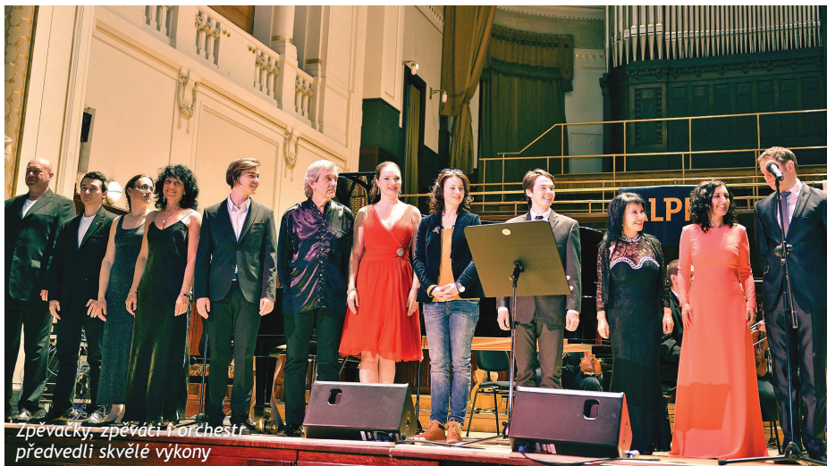
Zpěváci, zpěváci i orchestr předvedli skvělé výkony