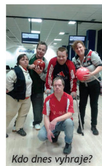
Kdo dnes vyhraje?