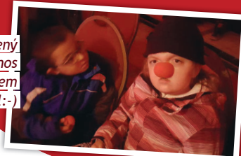
Červený nos dětem slušel! :-)

Pro svůj úspěch pokračuje DOBROČINNÝ BAZAR DO PTIC - 8.12. (13-18 h), 9.12. (9-17 h)