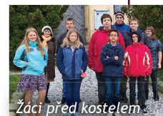
Žáci před kostelem