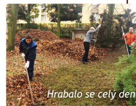
Hrabalo se celý den

Zaměstnanci Středočeských vodáren již roky pomáhají ve škole Slunce v rámci svých dobrovolnických dní při údržbě