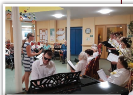
Vystoupení našeho sboru

Pěvecký sbor Slunce potěšil 29. 5. svým vystoupením klienty Domova seniorů Zelená lípa v Hostivici. Senioři,