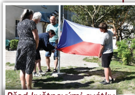
Před květnovými svátky jsme vyvěsili státní vlajku

U příležitosti dvou květnových státních svátků jsme vyvěsili státní vlajku na náš zbrusu nový stožár na zahradě školy v Unhošti.