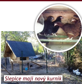
Slepice mají nový kurník

Na Nouzov nám přibýly nové obyvatelky a to osm slepic, kterým náš údržbář Václav postavil nový kurník. Uživatelé domova se na ně chodí každý den dívat, krmí je a netrpělivě čekají až snesou vajíčka. Těšíme se, že i někdo z vás se na ty naše slepičky "holky" přijede podívat. Také budeme rádi, pokud nám budete shromažďovat skořápky od vajec, které slepičky mají rády (kontakt Ivana Kankrlíková tel. 312 690 121). Text: ik