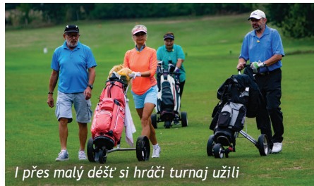
I přes malý déšť si hráči turnaje užili

je a prodeje našich výrobků byl celkem 16 500 Kč a věnován byl na nákup mrazáku pro cvičnou Kavárnu Slunce, která zaměstnává zdravotně znevýhodněné osoby. Děkujeme všem, kteří na Botaniku dorazili a spojili příjemné s užitečným. ■