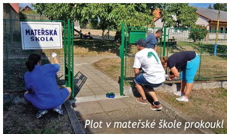
Plot v mateřské škole prokoukl

DOBROVOLNICKÁ PRÁCE JE PRO SPOLEČNOST VELICE DŮLEŽITÁ