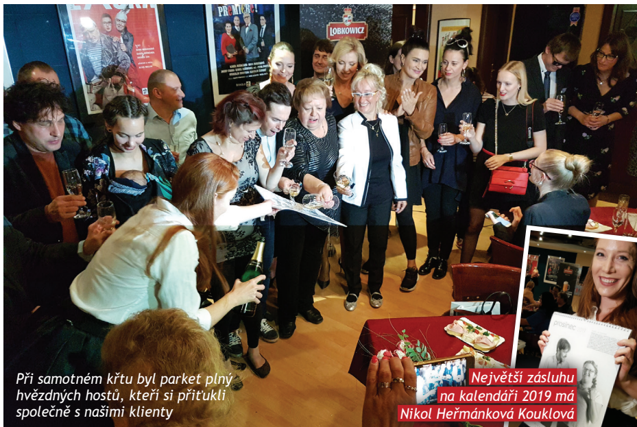
Při samotném křtu byl parket plný hvězdných hostů, kteří si přitukli společně s našimi klienty