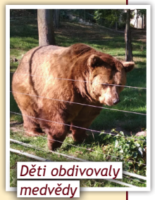
Děti obdivovaly medvědy

Za medvědy do Berouna se v září vydali žáci školy Slunce v Unhošti. V místním medvědáriu žijí "hvězdy" známého večerníčku Méd'ové. Už to nejsou sice žádní malí medvidci, ale pořádní obři, i tak se dětem zdáli roztohilí. A protože bylo krásné slunečné počasí, následovala příjemná procházka po dél Berounky.