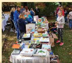
Koupit jste si mohli knížky, hračky a další bazarové věci

Není zvykem, že ve stochovské škole Slunce pořádáme akce pro veřejnost. Rádi bychom to změнили a více se obyvatelům Stochova otevřeli. Jednou z prvních vlašťovek byl Garážový výprodej, který proběhl na zahradě školy v pátek 12. října. Za nezvykle teplého počasí jsme prodávali za symbolické ceny věci, které nám po letním úklidu zbyly, a které již ve školách nevyužijeme. Jsme rádi, že mohou posloužit a udělat radost dál. Součástí bazaru byl také stánek s občerstvením ze cvičné pekárny Slunce v Unhošti.