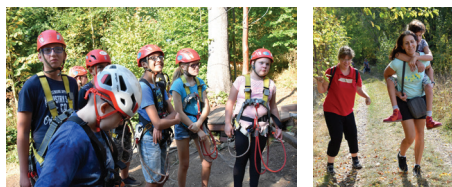
V lanovém parku byly děti opravdu šikovné a zručné.