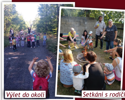
Výlet do okolí