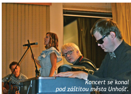
Koncert se konal pod záštitou města Unhošť.