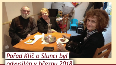
Pořad Klíč o Slunci byl odvysílán v březnu 2018