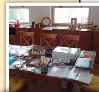
SPC-PPP ve Stochově

Pro zájemce jsme uspořádali 8. listopadu ve škole Den otevřených dveří. Prohlédnout jste si mohli prostory speciálně pedagogického centra a pedagogicko-psychologické poradny, třídy a zahrady škol. U kávy byla možnost popovídat si s našimi pedagogy na téma speciální školství. Poskytujeme poradenství před nástupem do školy, vzdělávání dětí se speciálními potřebami, psychologickou péčí, sociální poradenství. Pokud jste Den otevřených dveří nestihli, nevádejte, zavolejte a domluvíme se na individuální prohlídce.