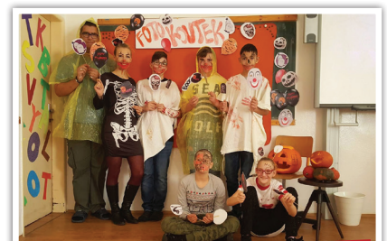
• Halloweenské řádění proběhlo také ve škole ve Stochově. Žáci si vyrobili masky, dlabali dýně a vytvořili si vtipný fotokoutek.

Halloween. Povíдали jsme si o našich zvycích a mezinárodních svátcích. V Kyšicích byly děti oblečené do kostýmů a masek, soutěžily v koulení dýní na kuželky a házely kroužky na čarodějův klobouk. Také v Horním Bezděkově pobíhaly strašidylka, dlabali si dýně a děti hrály hry. Odměnou nám všem bylo příjemně strávené dopoledne a nechyběly sladkosti, které si děti odnesly domů. Text: M. Řečinská