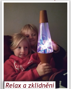
Relax a zklidnění ve snoezelenu

V Domově dobré vůle v Nouzově máme vybudovanou terapeutickou terapeutickou multismyslovou místnost tzv. snoezelen, která je již čtyři roky využívána nejen klienty, kteří v domově bydlí, ale i dětmi z naší základní a mateřské školy. Na Nouzov dojíždí jednou týdně a v místnosti relaxují, pobyt je uvolňuje a zklidňuje, vyvolává pocit jistoty a celkově působí pozitivně na jejich zdraví.