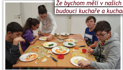
Že bychom měli v našich žácích budoucí kuchaře a kuchařinky?:-)

Starší žáci naší základní školy se účastní projektu Vrapické dílničky, který organizuje SOU a PŠ Kladno - Vrapice. Během první návštěvy Vrapic na ně čekal program zaměřený na truhlářinu. Projekt si klade za cíl obeznámit žáky ze základních škol se zajímavými učebními obory. Naše skupina byla velmi zručná a především děvčata velice přesná. Druhá dílnička byla pastvou nejen pro oči, ale i ústa. Děti chystaly studené občerstvení - zdravé ježky a toustové lvičky. Text: M. Jirásková