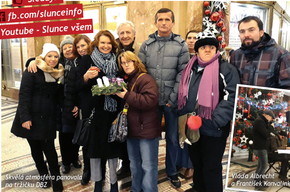
Skvělá atmosféra panovala na tržičku DBZ