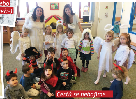
Čertů se nebojíme...