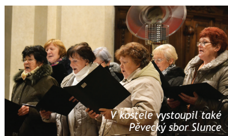
V kostele vystoupil také Pěvecký sbor Slunce

výrobků na výstavě bude využit v rámci veřejné sbírky na podporu školy Slunce. Jako každoročně se koncertu účastnili uživatelé našich služeb z Nouzova. Nejen pro ně byl koncert opět velkým zážitkem. ■