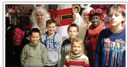
Soudě podle úsměvů byly děti hodné, něčeho se nebály a štědrá nadílka si užily