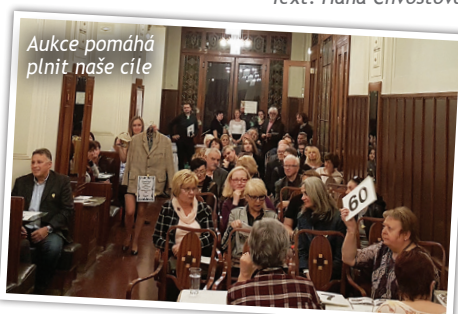
Aukce pomáhá plnit naše cíle