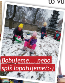
Bobujeme... nebo spíš lopatujeme?:-)