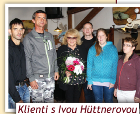
Klienti s Ivou Hüttnerovou