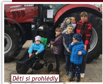
Děti si prohlédly zemědělské stroje