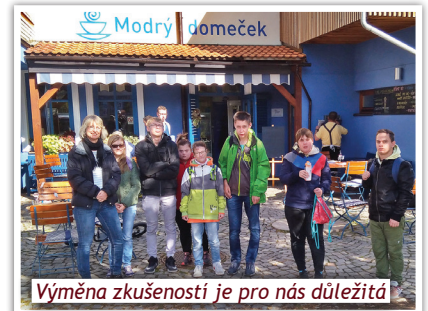
Výměna zkušeností je pro nás důležitá

Před časem jsme jeli s praktickou školou na exkurzi do podobného zařízení jako je naše. Jmenuje se Centrum sociální rehabilitace Náruč v Dobřichovicích. Návštěva byla přínosná, vyměnili jsme si zkušenosti a kontakty. Také jsme měli možnost navštívit jejich kavárnu Modrý domeček v sousedních Řevnicích, v níž obsluhují klienti sociálního zařízení a jeden z nich absolvoval naši školu. Text: J. Nováková