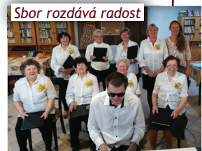
Sbor rozdává radost