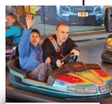
Na autodromu jsme strávili hodně času:-)

Do Prahy na tradiční Matějskou pouť jsme vyrazili v pondělí 1. dubna v rámci dne pro zdravotně postižené osoby. Výlet se nám moc líbil, využili jsme volné vstupy na atrakce a příjemně se pobavili.