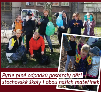
Pytle plné odpadků posbíraly děti stochové školy i obou našich mateřinek

Také my jsme se letos zapojili do kampaně Uklidme svět, uklidme Česko. S dětmi stochové školy Slunce jsme vyšli do ulic a pomohli jsme společně uklidit okolí školy a další místa ve městě. Děti si přinesly z domova svoje rukavice i odpadkové pytle. Akce Uklidme Česko doputovala i do našich školek. Děti si navlékly rukavice a přiložily ruce k dílu. Vyčistily nejen školní zahradu a pískoviště, ale i okolí školky. Bylo skvělé, jaký elán do úklidu měly. Ať jim vydrží!