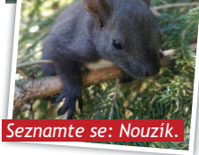
Seznámte se: Nouzík.