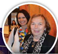
Pozváni na koncert přijala i bývalá první dáma ČR Livia Klausová

► Více fotek na našem facebooku: fb.com/slunceinfo