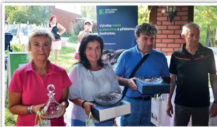
Vítězové si odnesli pěkné ceny, za které děkujeme sponzorům