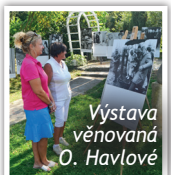
Výstava věnovaná O. Havlové

bylo vidět, jak si vychutnávají hezký den v nelehké době.