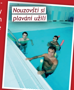
Nouzovští si plavání užili!

Od září mají naši klienti i žáci ze školy možnost účastnit se relaxačního plavání, na které jezdíme jednou týdně. Změnili jsme místo a nově využíváme bazén v hotelu Astra v Srbech nedaleko Kladna s příjemně teplou vodou. Plavání patří mezi vhodné aktivity pro lidi se zdravotním postižením, prohlubuje dýchání, relaxuje, otužuje či rozvíjí charakterové vlastnosti jako je rychlost, odvaha.