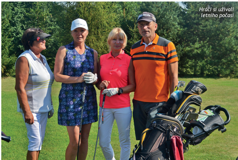
Hráči si užívali letního počasí