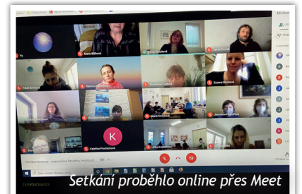
Setkání proběhlo online přes Meet

Pololetní prázdniny jsme ve škole Slunce opět využili k uspořádání Minikonference. Konala se již po čtvrté a vzájemně jsme si předávali zkušenosti a novinky z oblastní poradenské a speciální pedagogiky. Vzhledem k současné situaci se akce uskutečnila jako videokonference přes Google Meet.