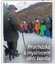
Procházka s myslivcem děti bavila

Ve školce v Horním Bezděkově proběhla v lednu beseda s myslivcem. Vyrázili jsme do přírody a povídali si o zvířátkách v lese, o stopování a vůbec o tom, co to myslivost je. Děti byly nadšené a je možné, že máme ve Slunci budoucí myslivce.