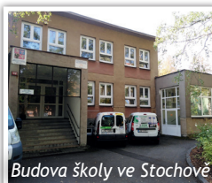
Budova školy ve Stochově

Škola Slunce zahájila svůj provoz v neděli 1. září 1991 jako první soukromá škola v ČR. Založení předcházelo mnoho intenzivních jednání jak s rodiči, kteří hledali pro své hendikepované děti vzdělávací zařízení, tak s úřady a starosty měst. Místo pro školu se nehledalo lehce, nakonec jsme se domluvili s městem Stochov a jeho osvětleným starostou na pronájmu budovy, ve které sídlí škola do současnosti. Na rekonstrukci a vybavení se podíleli rodiče i učitelé, mnoho věcí se provedlo svépomocí a s velkým nadšením.