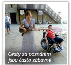
Cesty za poznáním jsou často zábavné

Spolupráce školy Slunce a společnosti Philip Morris ČR a.s. probíhá úspěšně již pět let. Díky grantu můžeme realizovat projekt Cesta ke vzdělání, který nám pomáhá v mnoha oblastech. Pomocí získaných finančních prostředků hradíme svozy a rozvozy našich žáků z celého kladenského regionu i výlety a oblíbené exkurze za poznáním. Dokud to situace dovolila, nevynechali jsme ani terapeutické ježdění na koních či pobyt ve snoezelenu. A nejen to! V současné komplikované době pro nás podpora Philip Morris představuje velkou pomoc v zajištění kontinuity kvalitního vzdělávání i v nestandardních a pro všechny nových podmínkách. Velice nás těší, že projekt Cesta ke vzdělání bude pokračovat i v dalším roce a věříme, že se již brzy budeme moci s našimi žáky opět rozjet do světa.