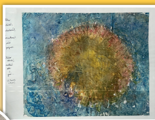
Kdo dává, dostává, mnohem víc přijme. Kdo ztrácí, nalézá sebe i jiné. František z Assisi

Vědomí, že naše práce má smysl a pozitivní vliv na okolí nás motivuje a žene kupředu. U příležitosti ukončení sociálně aktivizační služby v rodině, které se podařilo naplnit cíl podpory, jsme od ní dostali milou a potěšující pozornost. Je to vlastnoručně namalovaný obraz "Slunce" s připsaným citátem Sv. Františka z Assisi a věnováním (na zadní straně obrazu). Citát má dobrý vztah k sociální práci.