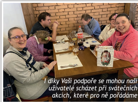
I díky Vaší podpoře se mohou naši uživatelé scházet při svátečních akcích, které pro ně pořádáme

Klienti i zaměstnanci centra, členové správní rady a vedení školy Slunce doslova doklouzali do pěkně vyzdobené restaurace, kde na ně čekalo výborné jídlo podle výběru - buď smažený řízek a bramborový salát, svíčková či kachna. Vše bylo výborné! Nechyběla polévka a také dezert. Uživatelé služeb se na slavnosti oběd dlouho těšili. Uvnitř to hučelo jak v úle, rozdávaly se dárky a přály se krásné vánoční svátky. Byl to hezký strávený čas s našimi klienty a oslava nadcházejících svátků. ■