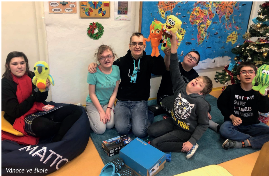
Vánoce ve škole