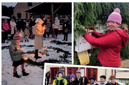
▲ Besídka v Horním Bezděkově

Ve školce v Horním Bezděkově vyšly děti do lesa pozorovat zvířata a odnesly jim do krmelců vhodnou potravu. Úspěch také sklídila besídka na téma vánočního příběhu zrození Ježíška. ■