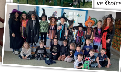
Pohádkové bytosti ve školce