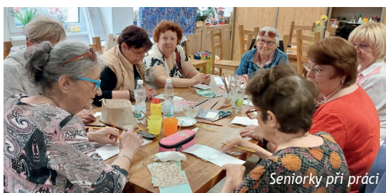
Seniorky při práci

TVOŘENÍ ROZVÍJÍ FANTAZII A PROCVIČUJE MOTORIKU