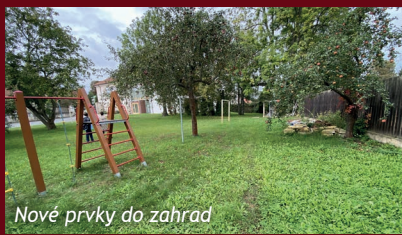
Nové prvky do zahrady

Zahrady školy Slunce v Unhošti a mateřské školy v Kyšicích projdou úpravami. Pro obě místa jsme uspěli s našimi projekty v rámci dotačního řízení Státního fondu životního prostředí ČR. Slibujeme si zkvalitnění technického a didaktického zázemí pro environmentální výuku ve venkovním prostředí. Cílem projektu ve školce je rozšíření aktivit o přírodní prvky „živé zahrady“ a možnosti být přírodě blíží.