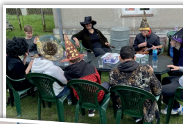
Žáci si zazpívali a opekli buřty