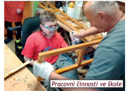
Pracovní činnosti ve škole

Žáci druhého stupně školy Slunce jsou zvědaví a rádi zkusí nové věci. V rámci pracovních činností zavítali do školní dílny, kde pod zkušeným dohledem "kutili". Osvojují si tak základní pracovní návyky, dovednosti i postupy. Zkouší pracovat s různými materiály. Odměnou jim je hotový výrobek, ze kterého mají školáci radost.