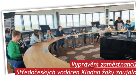
Vyprávění zaměstnanců Středočeských vodáren Kladno žáky zaujalo

Další projektový den zavedl žáky do Středočeské vodárny v Kladně, kde si prohlédli zrekonstruovanou Future Tower - původní vodojem. Během exkurze si zopa-