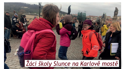
Žáci školy Slunce na Karlově mostě

Bojovka na Karlově mostě a na Kampě? Proč ne! Jednotlivá družstva žáků stochovské školy soutěžila o zlatáky a drahokamy a prokazovala své znalosti o Karlu IV., jeho zásluhách a významu. Jejich správné odpovědi a snahu ocenila paní průvodkyně sladkou odměnou. Závěrečné občerstvení v Kavárně Mlýnská na Kampě pan majitel žákům věnoval zdarma, za což ještě jednou velmi děkujeme.