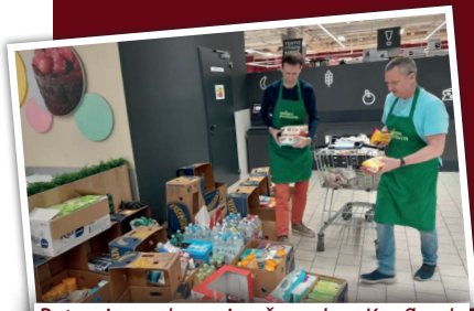
Potraviny a drogerie věnovalo v Kauflandu na pražském Vypichu plno dárců

V dubnu proběhla jarní celonárodní sbírka potravin, která je organizována potravinovými bankami. I my jsme se jí opět zúčastnili a v Kauflandu na pražském Vypichu jsme vybrali 1 930 kg potravin a drogerie. Během dne se na akci vystřídalo 8 dobrovolníků, kteří dary třídili a svázeli. Děkujeme všem, kteří nás podpořili a prostřednictvím Slunce pomohli lidem, kteří tuto pomoc potřebují.