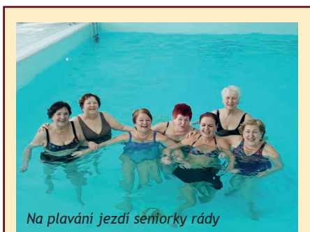
Na plavání jezdí seniorky rády