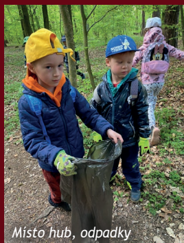
Místo hub, odpady

Ve školce v Horním Bezděkově jsme s dětmi probírali další důležité téma a tím byla ekologie. Předškoláci se naučili třídít věci podle materiálu a vysvětlili jsme si jaká barva kontejneru je pro jaký odpad. Vybavili jsme se pracovními rukavicemi a odpadkovými pytlíky a vyrazili jsme do nedalekého lesa. Místo hub, na které si musíme ještě počkat, jsme hledali to, co tam jiní lidé zahodili. Odpadky. A nebylo jich málo. Děti je posbíraly a odnesly je do kontejnerů na tříděný odpad.