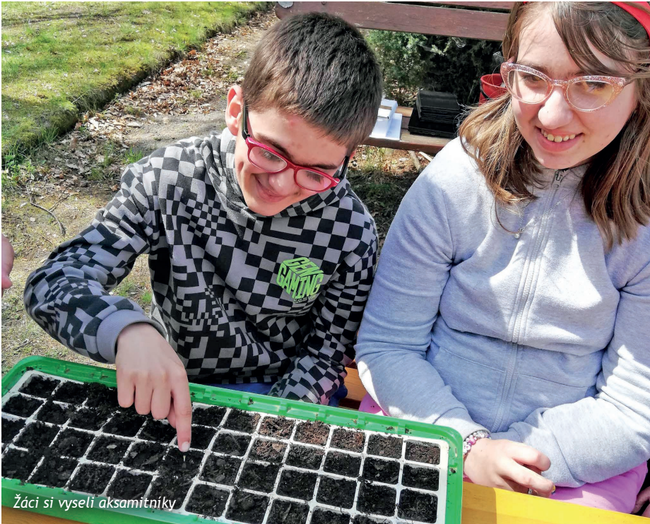
Žáci si vyseli aksamitníky