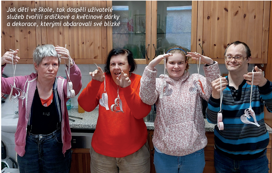
Jak děti ve škole, tak dospělí uživatelé služeb tvořili srdíčkové a květinové dárky a dekorace, kterými obdarovali své blízké