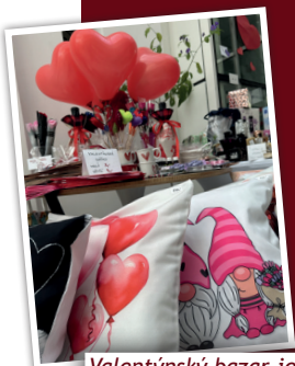
Valentýnský bazar je za námi a velikonoční jarmark se chystá

Nyní se připravujeme na další charitativní akci - tentokrát bude spojena s Velikonocemi, svátkem symbolizujícím znovuzrození, nadějí a radost. Těšit se můžete na široký výběr velikonočních dekorací, cukrovinek a originálních dáreků pro Vaše blízké. Těšíme se na Vaši návštěvu ve škole Slunce v Unhošti (20.-28. 3.) a ve škole Slunce ve Stochově (26.-28. 3.).