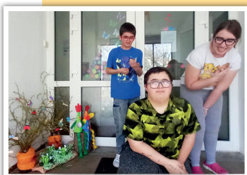
Z výsledných výtvorů měli žáci velkou radost

Cílem věcného učení je rozvíjení praktických dovedností, které jsou pro každodenní život důležité. Tato forma vzdělávání klade důraz na praktické aplikace znalostí, které mohou dětem s postižením pomoci v integraci do společnosti a získání nezávislosti.